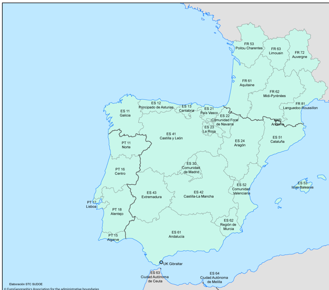
Figura 1 - Mapa do Espaço SUDOE

Em termos económicos , o Espaço SUDOE (especialmente nas regiões peninsulares de Portugal e Espanha) é particularmente afetado pelos efeitos da crise económica e financeira. Isso reflete-se em taxas negativas (ou praticamente nulas) de crescimento económico na maioria das regiões nos últimos anos, bem como na estagnação (ou mesmo reversão) do processo de convergência com as médias europeias (medidas em termos de PIB per capita ).